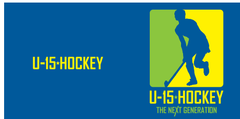
Tシャツ:ロイヤルブルー