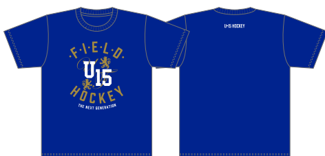
Tシャツ:ジャパンプルー