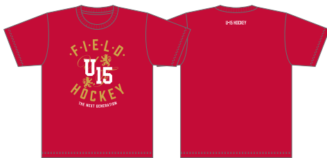
Tシャツ:ガーネットレッド